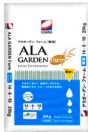
アラガーデン・ファーム