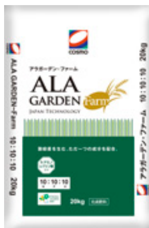
アラガーデン・ファーム