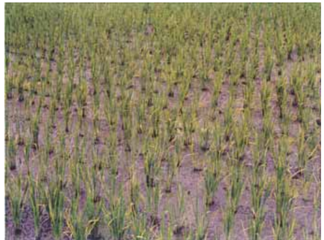
写真2 現地（被害大、落水中、1995）